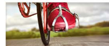
PARCOURS VÉLO DE ROUTE