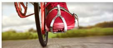
PARCOURS VÉLO DE ROUTE