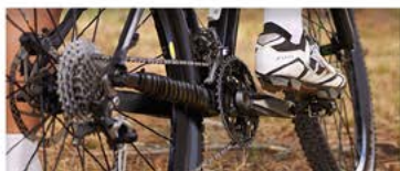
CIRCUITS VTT / VTC / VAE